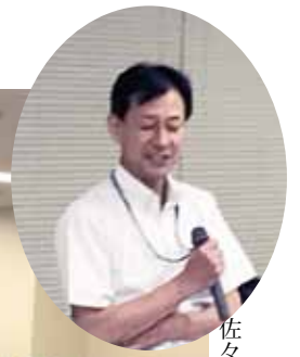
佐々木署長のご挨拶