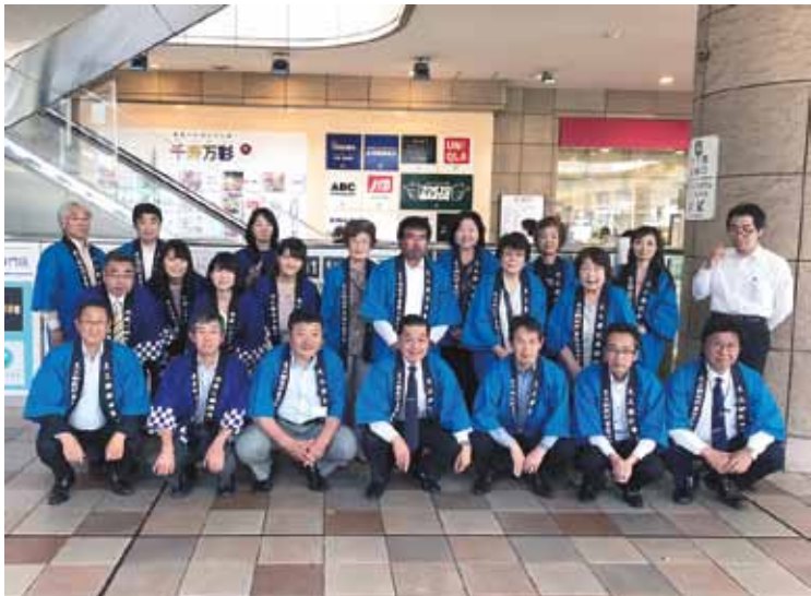
北千住駅頭にて都税キャンペーン

平成30年5月14日(月)北千住駅前において、足立納税貯蓄組合連合会と東京都足立都税事務所の共催で納期内納税キャンペーンを実施しました。都税事務所からも大勢の職員の方が参加して、同事務所からのキャンペーングッズとチラシなどを配布し街行く人々にPRしました。