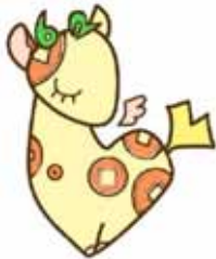
PRキャラクター「ぜいきりん」

納税者の利便性の向上など納税環境の整備のため、東京都62区市町村では、給与所得のある方は、原則として特別徴収とさせていただきます。